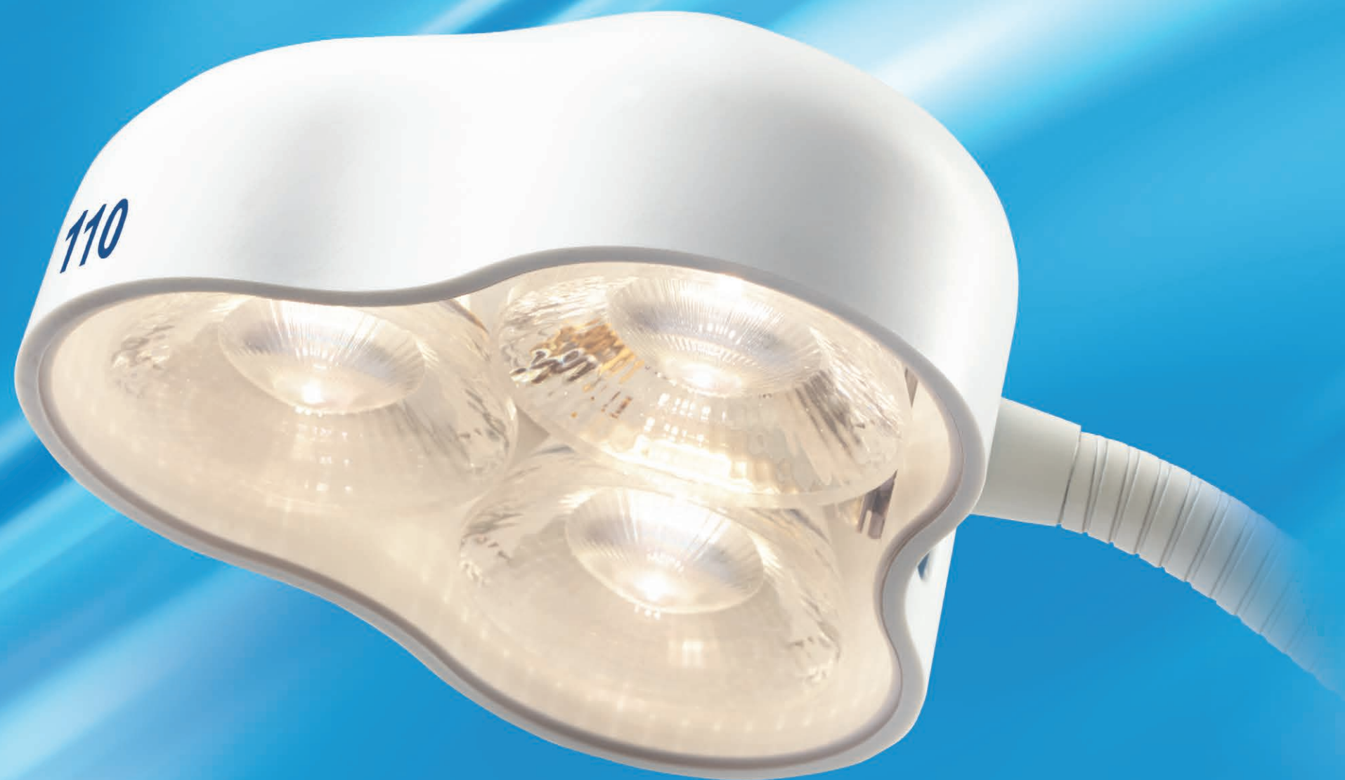
Mach LED 110 35 000 lux (à une distance de 0,5 m)

Lampe d'examen compacte avec technologie à LED pour le diagnostic et la prévention