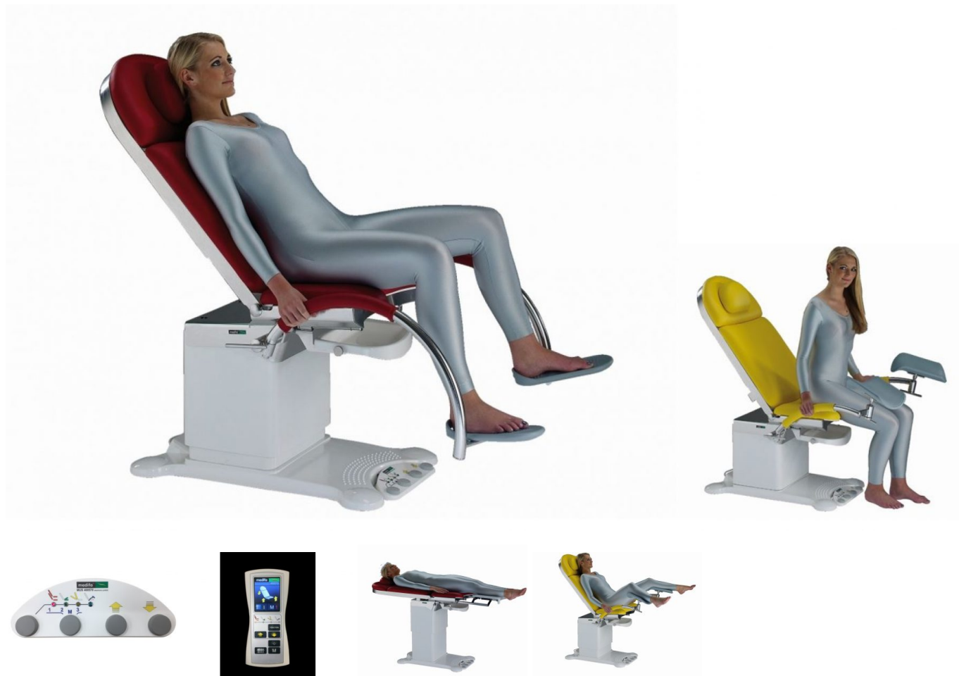
Table de consultation gynéco Medifa 4000 – Gynécologie

La table de consultation gynécologique Medifa 4000 est la référence de fabrication allemande pour la consultation gynéco. Avec un châssis et une colonne entièrement en aluminium laqué, un cadre entièrement en acier inoxydable massif, et des revêtements sans coutures ni agraffes, c'est un produit qui vous satisfera pendant de très longues années.