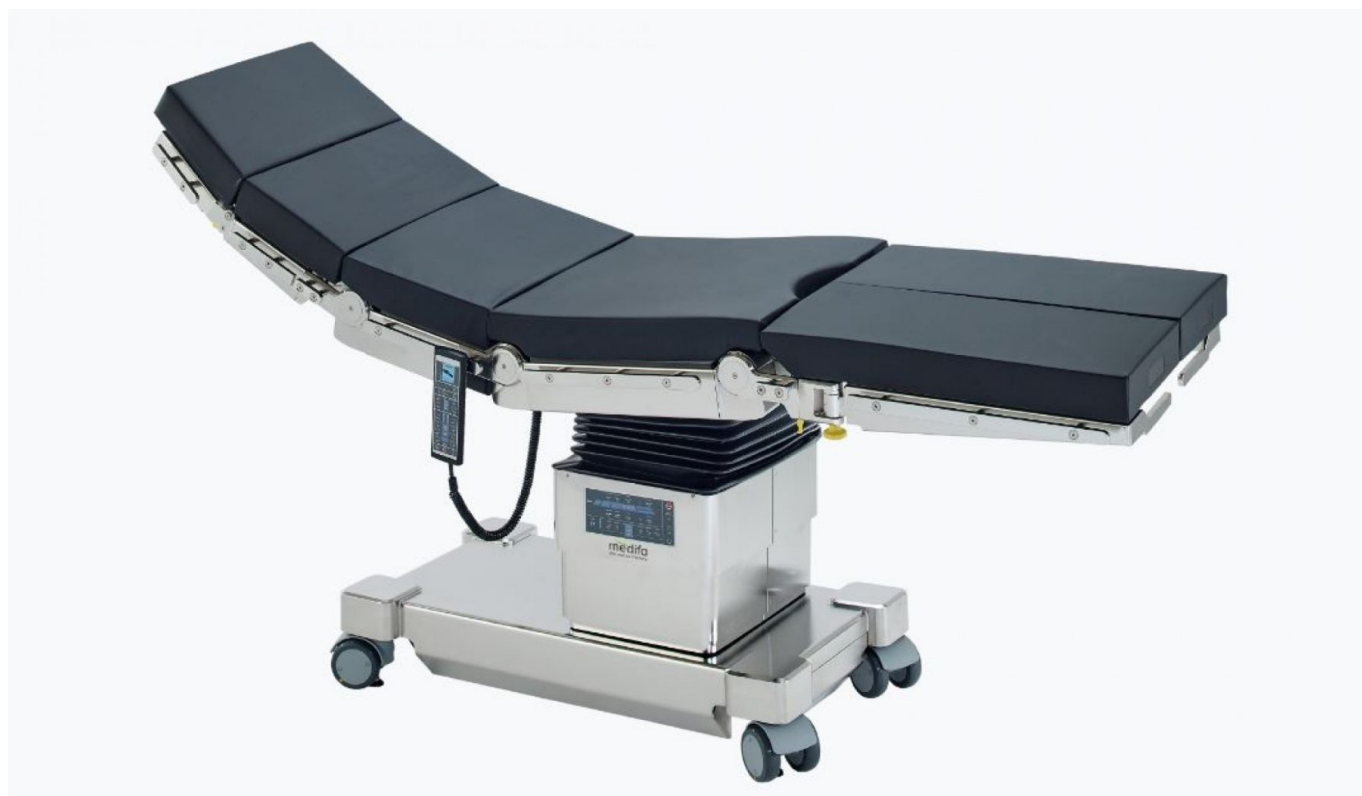
Table d'opération mobile à déplacement motorisé Medifa 7000