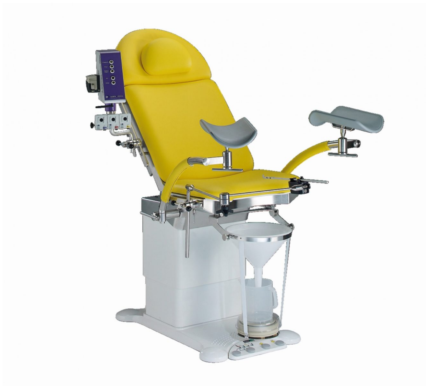
Table de consultation urologique Medifa 4000 – Urologie