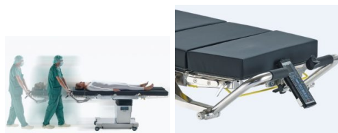
Table d'opération Medifa 7000 : la toute dernière génération de table polyvalente à déplacement motorisé