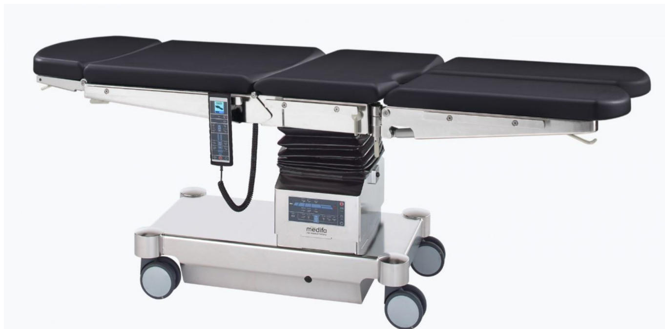
Table d'opération mobile à déplacement non motorisé Medifa 6000