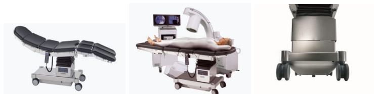
Table d'opération Medifa 6000 : une table polyvalente et performante pour un coût maîtrisé