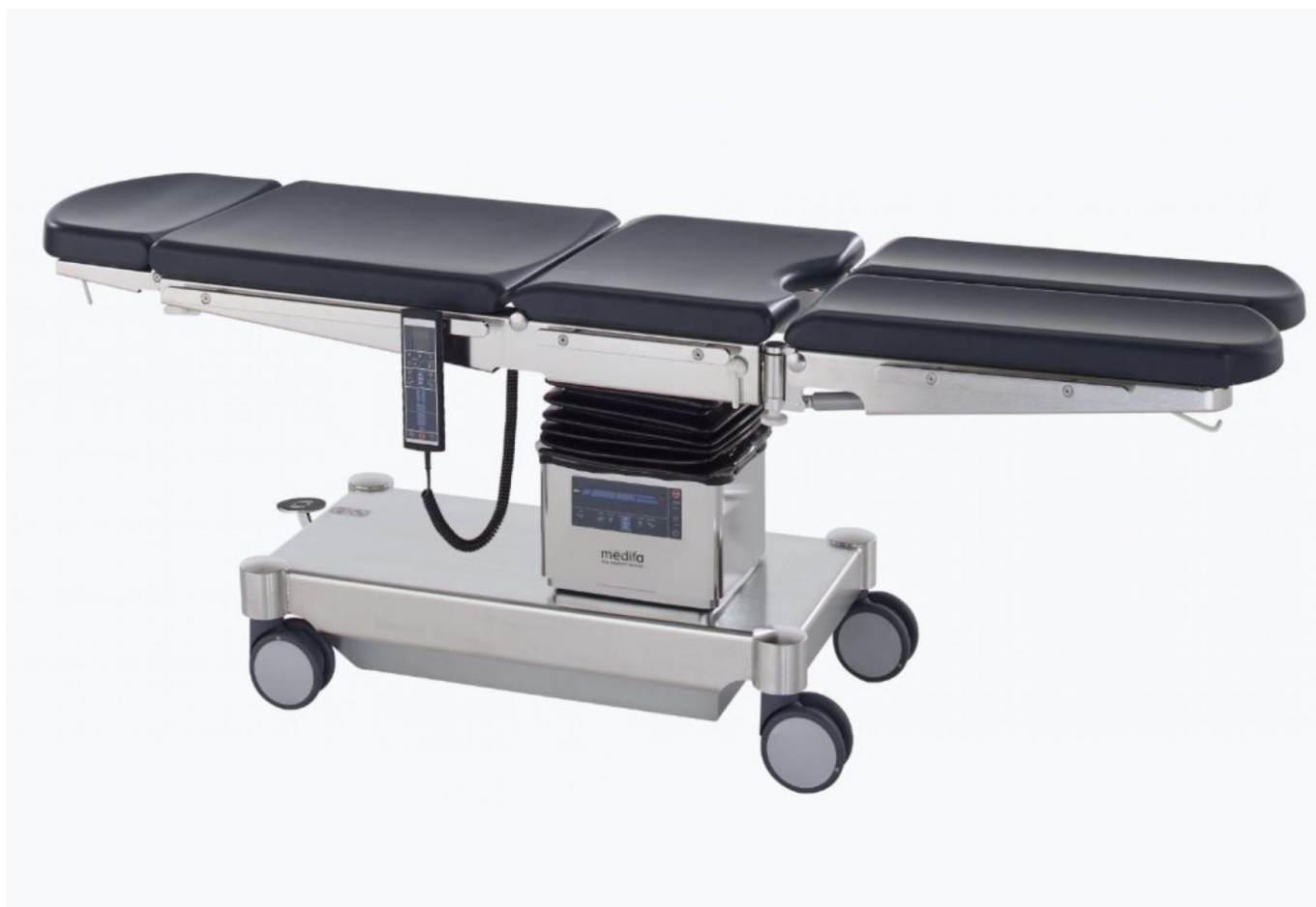
Table d'opération mobile ambulatoire Medifa 5000